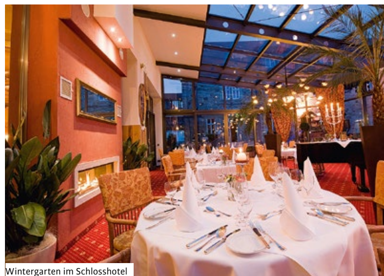
Wintergarten im Schlosshotel