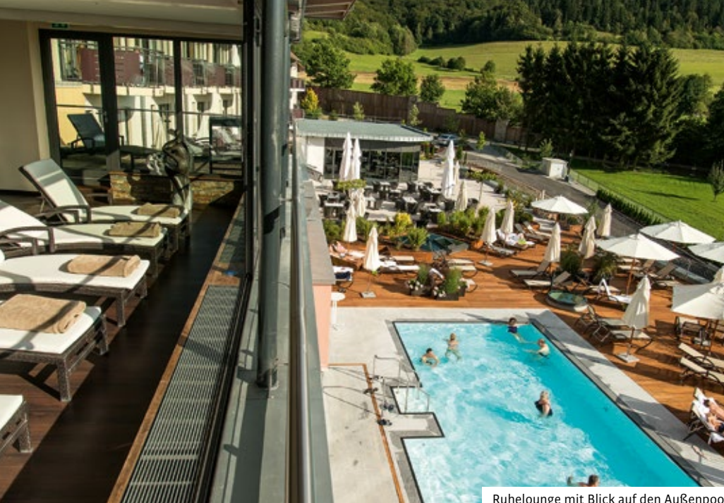
Ruhelounge mit Blick auf den Außenpool