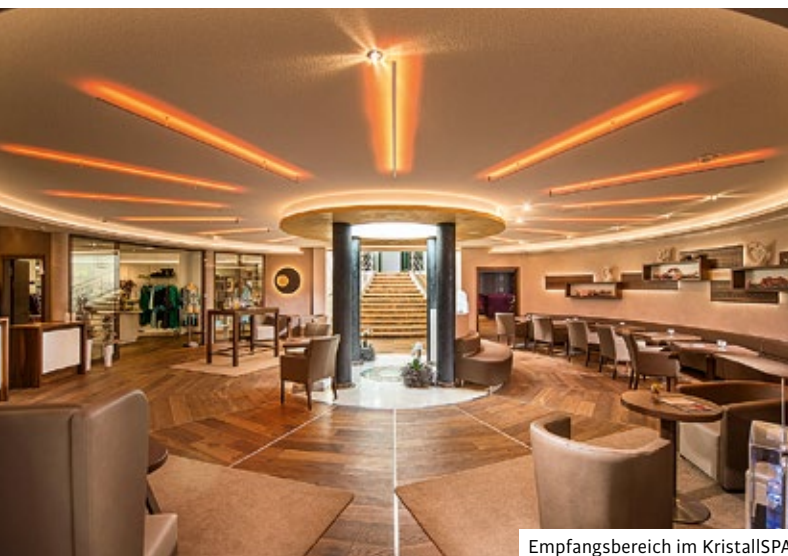
Empfangsbereich im KristallSPA