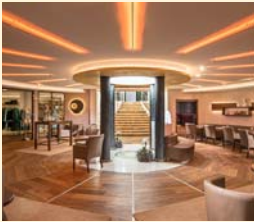
KristallSPA mit SPA-Bistro