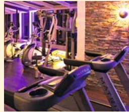
Cardio Fitness Raum