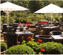
Sonnen- und Cafètterasse