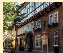
Hotel Brauhaus Zum Löwen 99974 Mühlhausen Tel. 03601/471-0