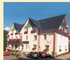
Göbel's Hotel Am Park 34508 Willingen Tel. 05632/987-0