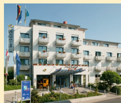
Posthotel Rotenburg 36199 Rotenburg a.d. Fulda Tel. 06623/931-0