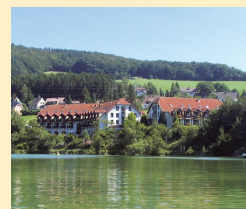
Hotel Diemelsee 34519 Heringhausen Tel. 05633/9931-0