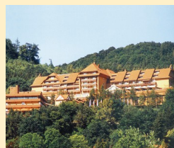
Göbel's Hotel Rodenberg 36199 Rotenburg Tel. 06623/88-1100