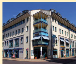
Göbel's Sophienhotel 99817 Eisenach Tel. 03691/251-0