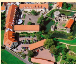
Göbel's Schlosshotel 36289 Friedewald / Bad Hersfeld Tel. 06674/9224-0