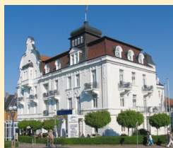
Göbel's Hotel Quellenhof 34537 Bad Wildungen Tel. 05621/807-0