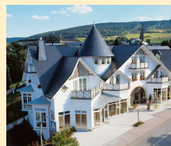
Göbel's Park Resort 34508 Willingen Tel. 05632/987-0