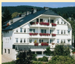
Göbel's Landhotel 34508 Willingen Tel. 05632/987-0

Durchatmen und entspannen fällt Ihnen bei uns in den Göbel Hotels leicht. Erleben Sie Inseln der Ruhe oder der Geselligkeit, gepflegte Gastlichkeit in einem attraktiven und stillvollen Ambiente in der wunderschönen Mitte Deutschlands.