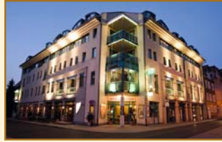
Göbel's Sophien Hotel 99817 Eisenach Telefon: 03691 251-0