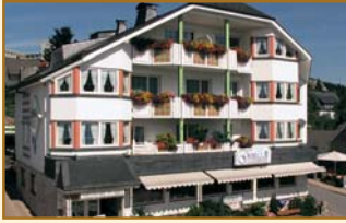
Göbel's Landhotel 34508 Willingen Telefon: 05632 987-0