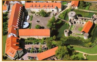
Göbel's Schlosshotel 36289 Friedewald b. Bad Hersfeld Telefon: 06674 9224-0