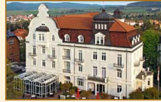
Göbel's Hotel Quellenhof 34537 Bad Wildungen Telefon: 05621 807-0