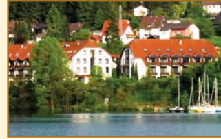
Göbel's Seehotel Diemelsee 34519 Diemelsee-Heringhausen Telefon: 05633 9931-0