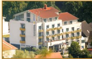
Posthotel Rotenburg 36199 Rotenburg a. d. Fulda Telefon: 06623 931-0