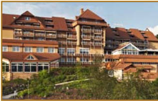
Göbel's Hotel Rodenberg 36199 Rotenburg a. d. Fulda Telefon: 06623 88-1100