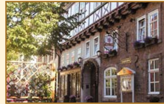
Hotel Brauhaus „Zum Löwen“ 99974 Mühlhausen/Thüringen Telefon: 03601 471-0