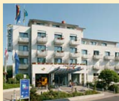
Posthotel Rotenburg 36199 Rotenburg a.d. Fulda Tel. 06623/931-0