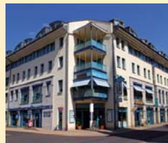
Göbel's Sophienhotel 99817 Eisenach Tel. 03691/251-0