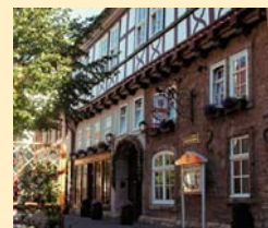
Hotel Brauhaus Zum Löwen 99974 Mühlhausen Tel. 03601/471-0