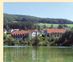
Hotel Diemelsee 34519 Heringhausen Tel. 05633/9931-0