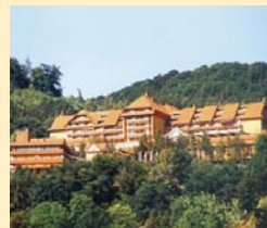
Göbel's Hotel Rodenberg 36199 Rotenburg Tel. 06623/88-1100