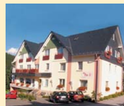
Göbel's Hotel Am Park 34508 Willingen Tel. 05632/987-0