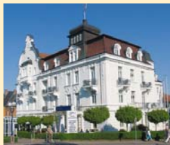
Göbel's Hotel Quellenhof 34537 Bad Wildungen Tel. 05621/807-0