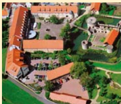
Göbel's Schlosshotel 36289 Friedewald / Bad Hersfeld Tel. 06674/9224-0