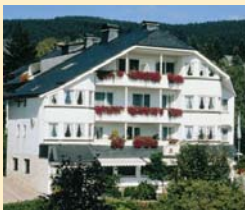
Göbel's Landhotel 34508 Willingen Tel. 05632/987-0

Durchatmen und entspannen fällt Ihnen bei uns in den Göbel Hotels leicht. Erleben Sie Inseln der Ruhe oder der Geselligkeit, gepflegte Gastlichkeit in einem attraktiven und stilvollen Ambiente in der wunderschönen Mitte Deutschlands.