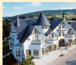
Göbel's Park Resort 34508 Willingen Tel. 05632/987-0