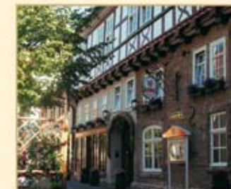
Hotel Brauhaus Zum Löwen 99974 Mühlhausen/Thüringen Tel. 03601 471-0