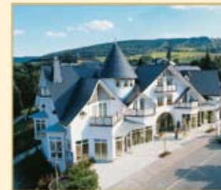
Göbel's Park Resort 34508 Willingen Tel. 05632 987-0