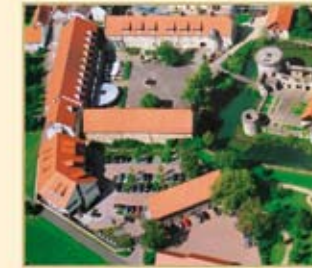
Göbel's Schlosshotel 36289 Friedewald b. Bad Hersfeld Tel. 06674 9224-0