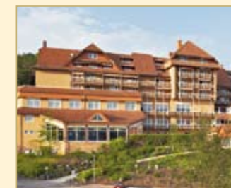
Göbel's Hotel Rodenberg 36199 Rotenburg a. d. Fulda Tel. 06623 881100