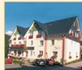
Göbel's Hotel Am Park 34508 Willingen Tel. 05632 987-191