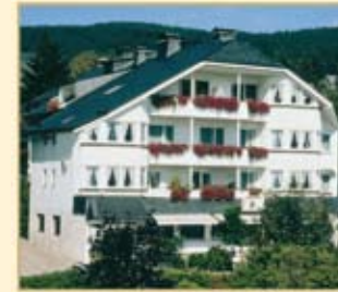
Göbel's Landhotel 34508 Willingen Tel. 05632 987-0