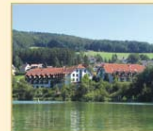
Hotel Diemelsee 34159 Diemelsee-Heringhausen Tel. 05633 9931-0