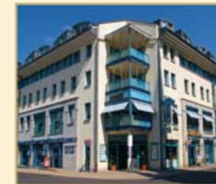
Göbel's Sophienhotel 99817 Eisenach Tel. 03691 251-0