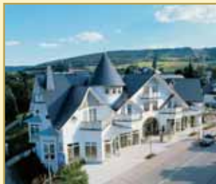
Göbel's Park-Resort 34508 Willingen Tel. 05632/987-0