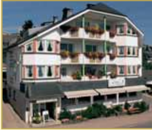
Göbel's Landhotel 34508 Willingen Tel. 05632/987-0