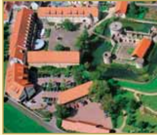
Göbel's Schlosshotel 36289 Friedewald b. Bad Hersfeld Tel. 06674/9224-0