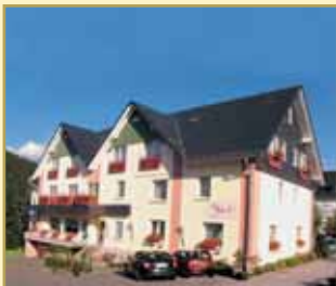
Göbel's Hotel am Park 34508 Willingen Tel. 05632/987-0