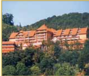
Göbel's Hotel Rodenberg 36199 Rotenburg a.d.Fulda Tel. 06623/88110-0