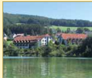
Hotel Diemelsee 34519 Diemelsee-Heringhausen Tel. 05633/9931-0