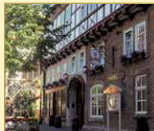
Hotel Brauhaus Zum Löwen 99974 Muhlhausen/Thüringen Tel. 03601/471-0