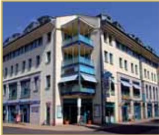
Göbel's Sophienhotel 99817 Eisenach Tel. 03691/251-0