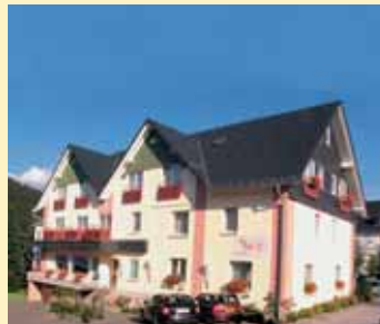
Hotel Am Park