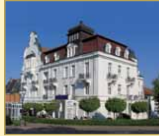
Göbel's Quellenhof 34537 Bad Wildungen Tel. 05621/807-0