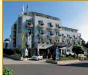
Göbel's Posthotel 36199 Rotenburg a.d.Fulda Tel. 06623/931-0