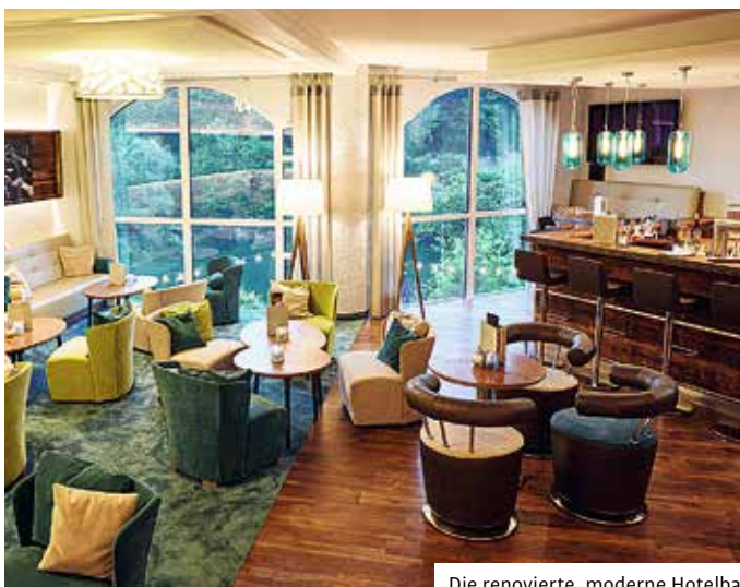
Die renovierte, moderne Hotelbar