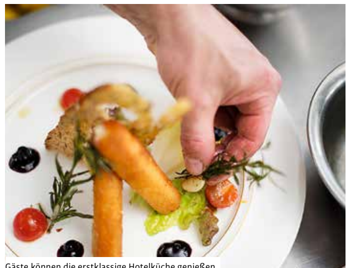
Gäste können die erstklassige Hotelküche genießen